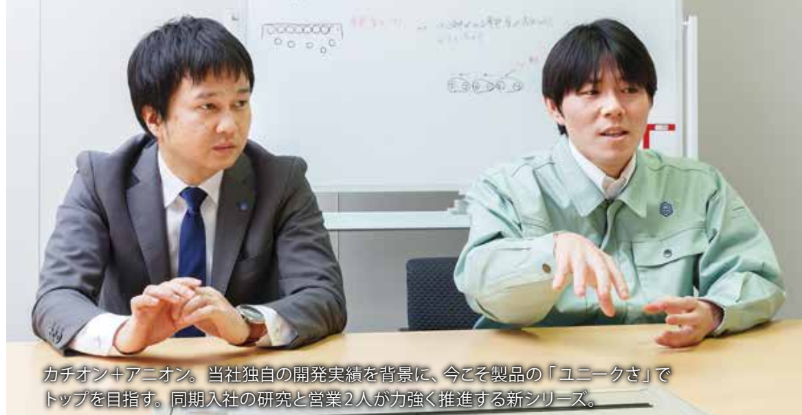
カチオン+アニオン。当社独自の開発実績を背景に、今こそ製品の「ユニークさ」で トップを目指す。同期入社の研究と営業2人が力強く推進する新シリーズ。

大型化や薄型化、さらに高い性能が求められる電子機器市場。 少量添加で帯電防止性能を高める添加剤。