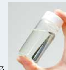
エレクセルASシリーズ