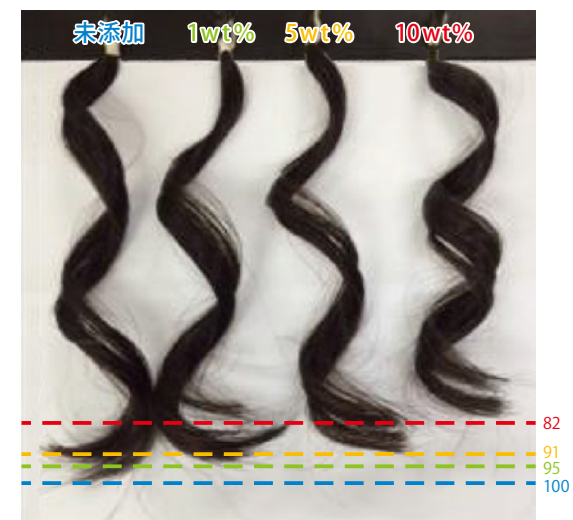
図3 髪のカール保持力 (未添加時と比較した相対値)

ることで高湿度状態でもカールの長さが保持される傾向にある。また、シャンプーで洗い流した際には未添加と同等の洗い上がり性であることを確認している。長時間、高湿度でカール保持力を発揮するヘアスプレー用途への応用が期待できる。